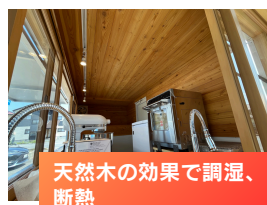
天然木の効果で調湿、 断熱

お客様から見えるところが全て 木になっているため、おしゃれ で清潔感があり、目立つ内装に なっております。