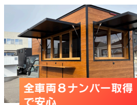
全車両8ナンバー取得 で安心

外の熱が中に伝わりにくい構造 になっています。オプションで 断熱材を加えるとさらに効果が あります。