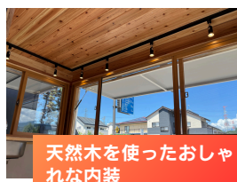
天然木を使ったおしゃ れな内装

お客様から見えるところが全て 木になっているため、おしゃれ で清潔感があり、目立つ内装に なっております。